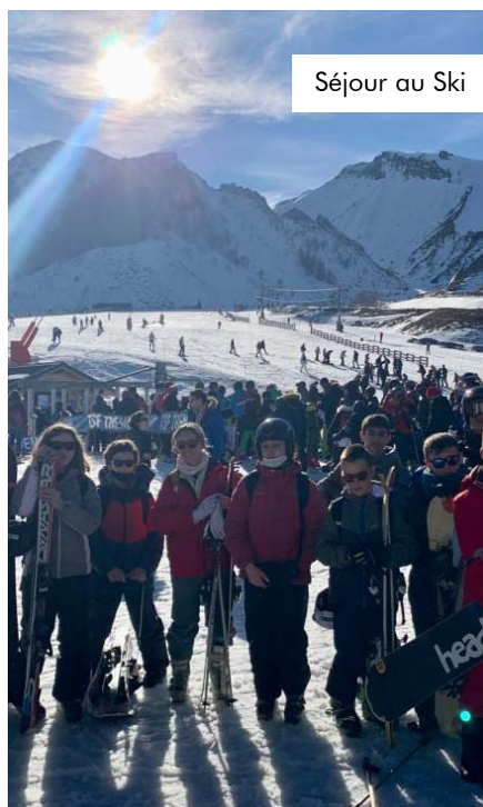
Séjour au Ski

• Deux journées sensibilisation/information au Handi-sitting suivies par 4 jeunes de plus de 16 ans