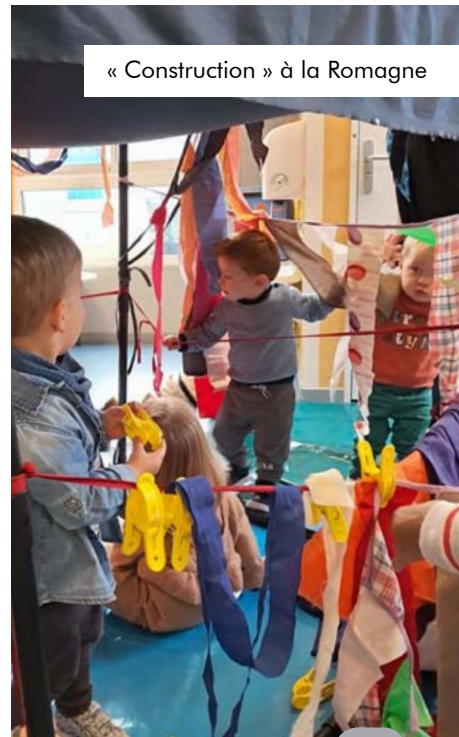
« Construction » à la Romagne

La diversification des propositions auprès des publics, familles et professionnels de la petite enfance, permet de répondre aux besoins de chacun dans l'intérêt de l'enfant accueilli .