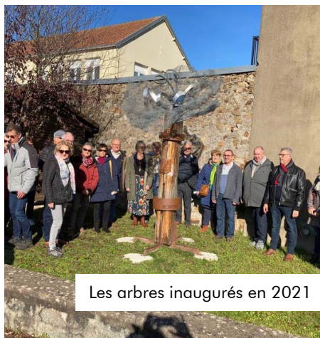
Les arbres inaugurés en 2021