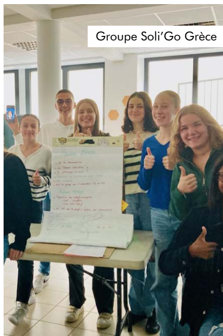
Groupe Soli'Go Grèce

• Un stage jeunesse Handifégo, 4 jours d'animation pour sensibiliser à la différence et au handicap