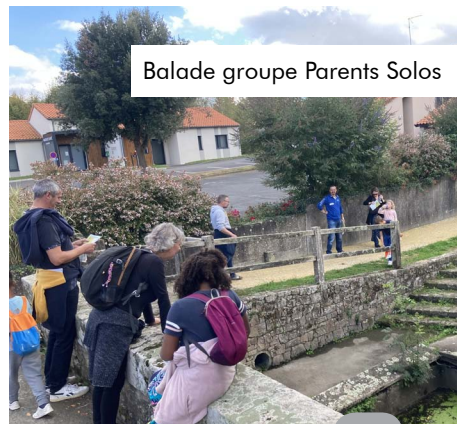
Balade groupe Parents Solos

À Bégrolles en Mauges, le projet a pris fin en 2022, faute de nouvelles forces vives pour porter le projet. Il est toujours possible de solliciter, de nouveau, le CSI.